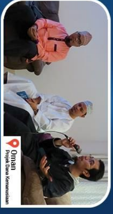
Omran Projek Dana Kemasyarakatan